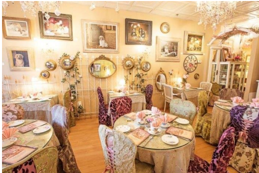
Clarissas Tearoom – Little Treasures