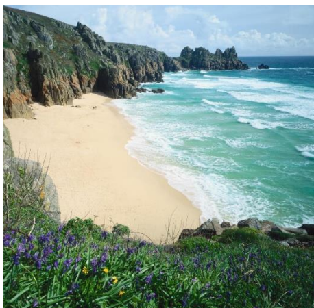
Die Bucht Smuggler's Bay